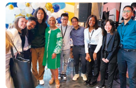
インターン先の友人と前委員長 (向かって左から2番目)

海外大学では、日本の大学では決してできない世界中につながる人脈を築くことができます。また、世界から集まる多様な価値観を持つ生徒と交流を深めることにより、物事を多角的に捉え、既存の考え方に縛られない柔軟な発想を身につけることができます。