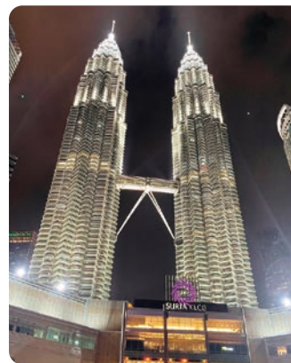
夜のクアラルンプール

日本の高校までの学生生活との相違点として、授業中はディスカッションをメインに進み、板書などは特にしません。必要な単語などは事前に渡される資料を読む必要があ