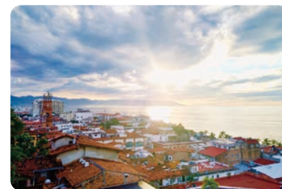
お気に入りの旅先の穏やかな港町

スペイン語は、スペインの他、ラテンアメリカでは北はメキシコ(あるいは米国内)から南はアルゼンチンまで、たくさんの国で話されています。発音は日本語に似ていて学びやすい言語です。日本人にとっては習得しやすい言語です。是非スペイン語を学び、色々な人と話して、豊かなスペイン語圏の世界に飛び出しましょう！