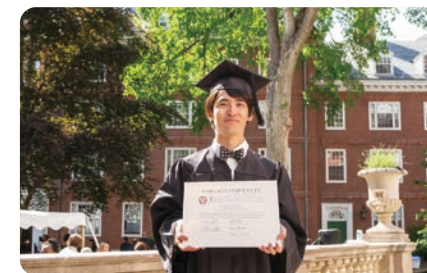
卒業式は3日間続きました

チャンスが目の前に来たらすぐに掴まなければならない。逃した後に悔やんでも遅いから。海外留学では、新しい挑戦の機会が増えることでしょう。その機会を活かすには特別な能力よりも、日々努力を重ねてチャンスを掴む準備を行うことこそが重要です。いつチャンスが巡ってきてでも掴めるように、よい準備をしてください！