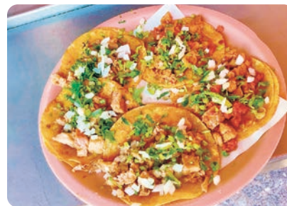
メキシコのソウルフード・タコス

メキシコの場合、学生寮などが無いので、まずは自力で家を探るところからスタート。現地の人の協力を得ながら、研修生それぞれに自分の家を探します。学校については、