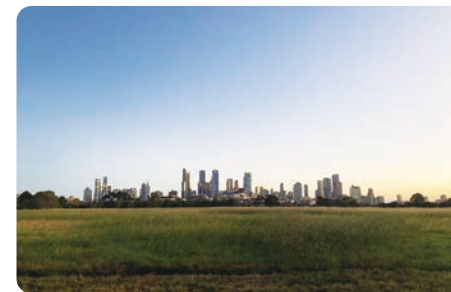
大学の近くの公園

海外に行っただけで、自分の中で何かが変わるわけではありません。新しい環境の中で、自分がどう生活するのが大切だと思います。留学先で何を実現したいのかを考え、具体的な答えが見つからなくても、積極的に行動し、大学を活用して大学生活を豊かにしてください！