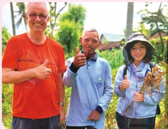
インドネシアにて(向かって一番右)