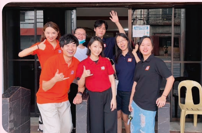
インターンメンバーで (前列左)

卒業後の予定は未定です。笑 ただ前職でもデジタルマーケティングの仕事をしており、更にそのスキルを日本だけのスケールに捉われずに伸ばさせたいという思いと、海外での業務経験をできるだけ若いうちに、積みたいとCOOPを選択しました。培ったマーケティングスキルを活かして、将来的にどの国や地域で働くかはまだ決めてないですが、とにかく今目の前の事に集中して頑張りたいと思っています！