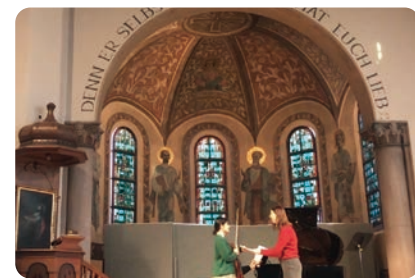
学校のお気に入りのホールでリハ

私は日本の大学を卒業してすぐにドイツに行ったわけではありませんでした。やはり外に出る事は怖かったです。でも全部が中途半端でずっといる自分が本当にいやでした。留学したらなにか変えられるかもしれないと思い、今しかない！と若さと勢いと無知さでとにかく突っ走っていました。ドイツという国をとっても、地域ごとにそのルールは違い、提出する書類も担当する人によって違ったりするので、結局は自分でどこまでどうするかが問われました。行動力のある人はその分だけチャンスがあります！