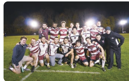
言葉の壁を超えたラグビー

「高島は海外大学の方が成長できるんじゃない？」海外在住経験のなかった私の海外大学進学への道は、ハーバードに進学した高校の先輩の一言で始まりました。最初は英語力が不安で自分には縁遠い世界だと思っていたのですが、一度は見学に行った方がいいと強く勧められ、