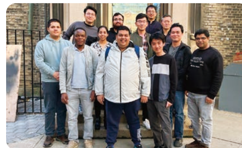
お世話になった研究室のメンバー

など実践的なスキルを身につけることができます。2年・3年次には、材料工学の専門科目を履修し、専門性を身につけていきます。特に、3年時の必修科目であるデザインプロジェクトでは、チームを組み、CADやFEA (有限要素法)、3Dプリンターを用いて1からものづくりを体験します。そして、4年次には、チームを組み、企業が抱える問題に対し学習した内容を活用して