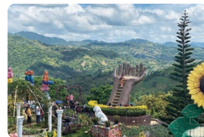
フィリピンの大自然を満喫

「日本人以外と直接コミュニケーションがとれる」というのは、人生を間違いなくプラスにしてくれると思います。翻訳機の精度が上がったとしても、直接会話する事で、表情や声量から気持ちを汲めるし、笑いだってとれます。(翻訳機でボケられても…と思うので。笑) 迷ったら、“今”がいちばん若い精神で、挑戦してみてください！