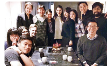
インパクト投資部の仲間と

何を、何のために学びたいのか。留学する理由や想いを言葉にすることが大切だと思います。海外大学での生活は楽しいことばかりではありません。辛いと感じた気持ちを乗り越えるために、また、主体的に学びを掴み取るためにも「自分がそこで頑張りたい理由」を言語化しておくことは大きな支えになるだろうと思います。