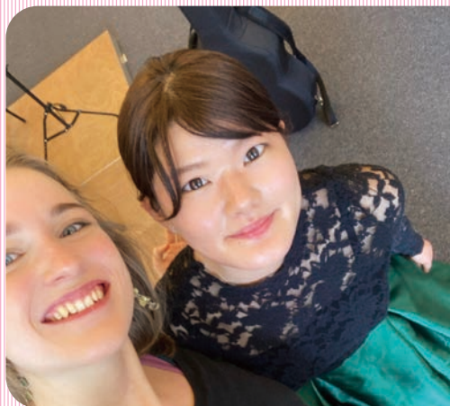
卒業演奏でたくさん支えてくれた子と

2023年洗足音楽大学準演奏補助 員、またフリーランスとして 活動中現在に至る。