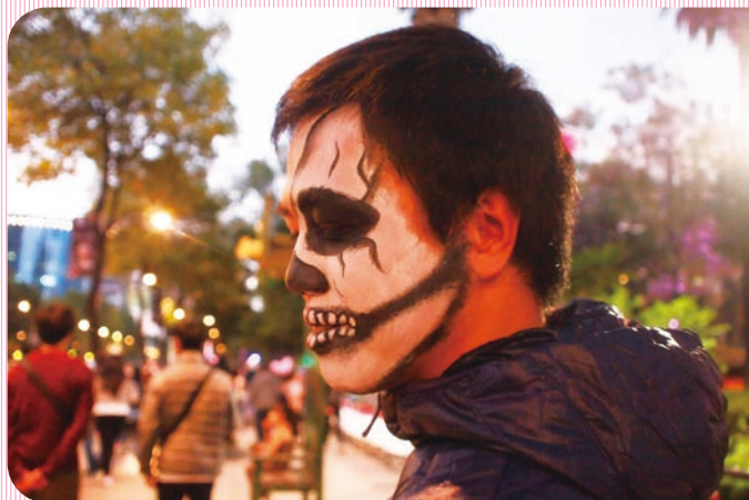
「死者の日」の骸骨メイク

専門調査員の任期満了後は、日 本に帰国予定。在籍中の同研究 科博士課程に復学予定。