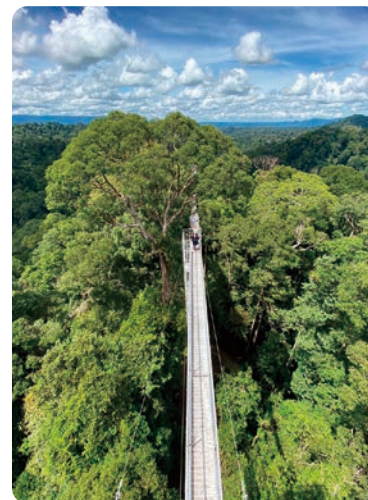
ウルトゥンブロン国立公園

最も日本と違うのはイスラームの国だということです。毎日5回モスクからアザーンが大音量で流れ、豚肉、アルコールは基本手に入りません。女性はほとんどがヒジャブをしていて、肌の露出も極力避けることが推奨されます。ただ、このような文化が違うだけで基本的なところは一緒なので、大きな不自由さを感じたことはありませんでした。授業は講義と課題が出て期末レポートやテストで成績がつき、寮も個室がありプライバシーはあります。大学が広すぎて移動が大変なこと以外は、苦勞も学内では特にあ