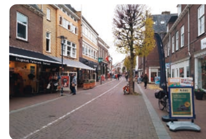
ワーヘニンゲンの街並み

もしもワーヘニンゲン大学に留学したい方、また海外で博士号を取得されたい方がいましたら、是非挑戦できるように私も応援いたします。道のりは険しく長いですが、一つ一つ乗り越えていけば、必ず目標に到達できます。お互いに頑張りましょう。