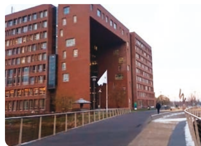
ワーヘニンゲン大学キャンパス内

進学先はオランダのワーヘニンゲン大学を選択しました。それは農業分野で世界一位の大学であったこと、私が研究したい間作の研究を専門的に行っている有名な先生がいたことが主な理由です。私の場合、博士課程に進学しようと決意したのは2018年でしたが、実際に進学できたのは2021年なので、準備に3年間かかったこととなります。準備で最も大変だったことは英語ですが、仕事との両立や、そして私は子どもをその期間に2人出産していたこともあり、家庭との両立も私の中では大きな課題でした。