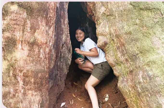
森で見つけた大きな木と