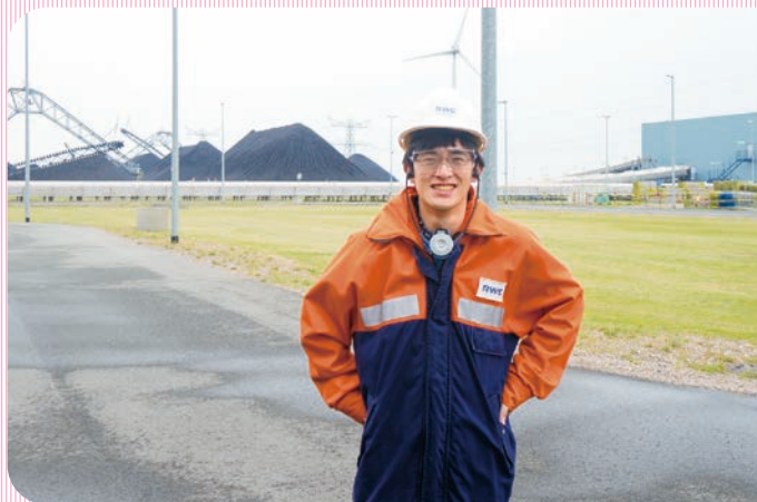
休学中、オランダで発電所を見学