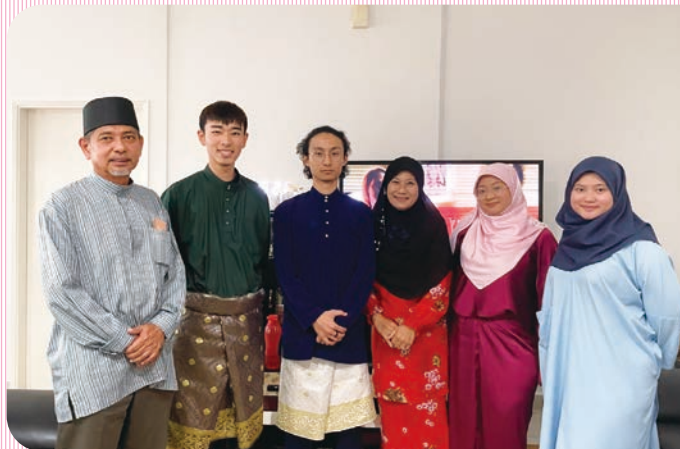
友人家族と伝統衣装を着て (向かって左から2番目、緑色の服)