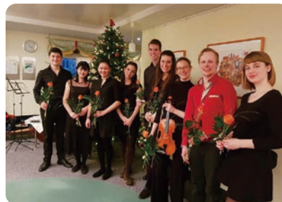
老人ホームで小さなコンサート (向かって左から2番目)

念願の大学院に合格し、とにかくたくさん音楽に没頭しました。クラシックのコンサートやオペラが学生だと安く、本当にたくさんのコンサートに行きました。やはりいろいろな事に慣れず、生きるのに精一杯でしたが、ひとつの音楽を共有したり、奏でる瞬間が留学生活で一番楽しい時でした。また私の先生は本当に愛情深い人で、練習だけでなくいろいろな事をして人間的に豊かになりなさいという人でした。そして繊細過ぎる私を「それがあなたの個性よ」と教えてくれま