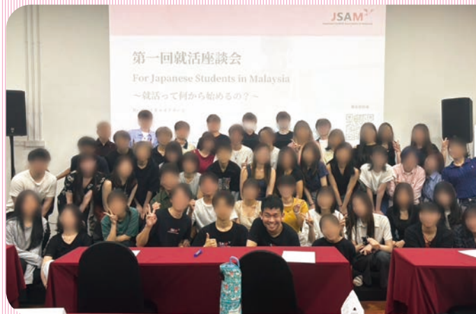
主催した就活イベントの一枚（最前列向かって左から6番目）