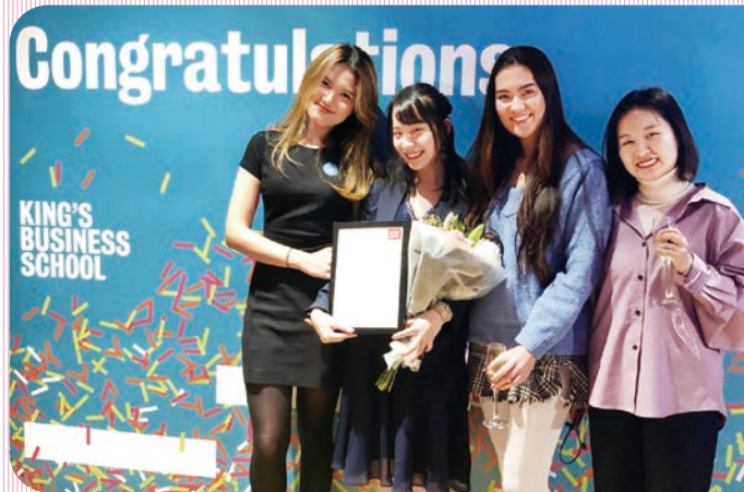
卒業論文の授賞式で友人と

学部卒業後は民間・非営利・政府関係の仕事に携わる。2022年にイギリスに戻り、現在に至る。